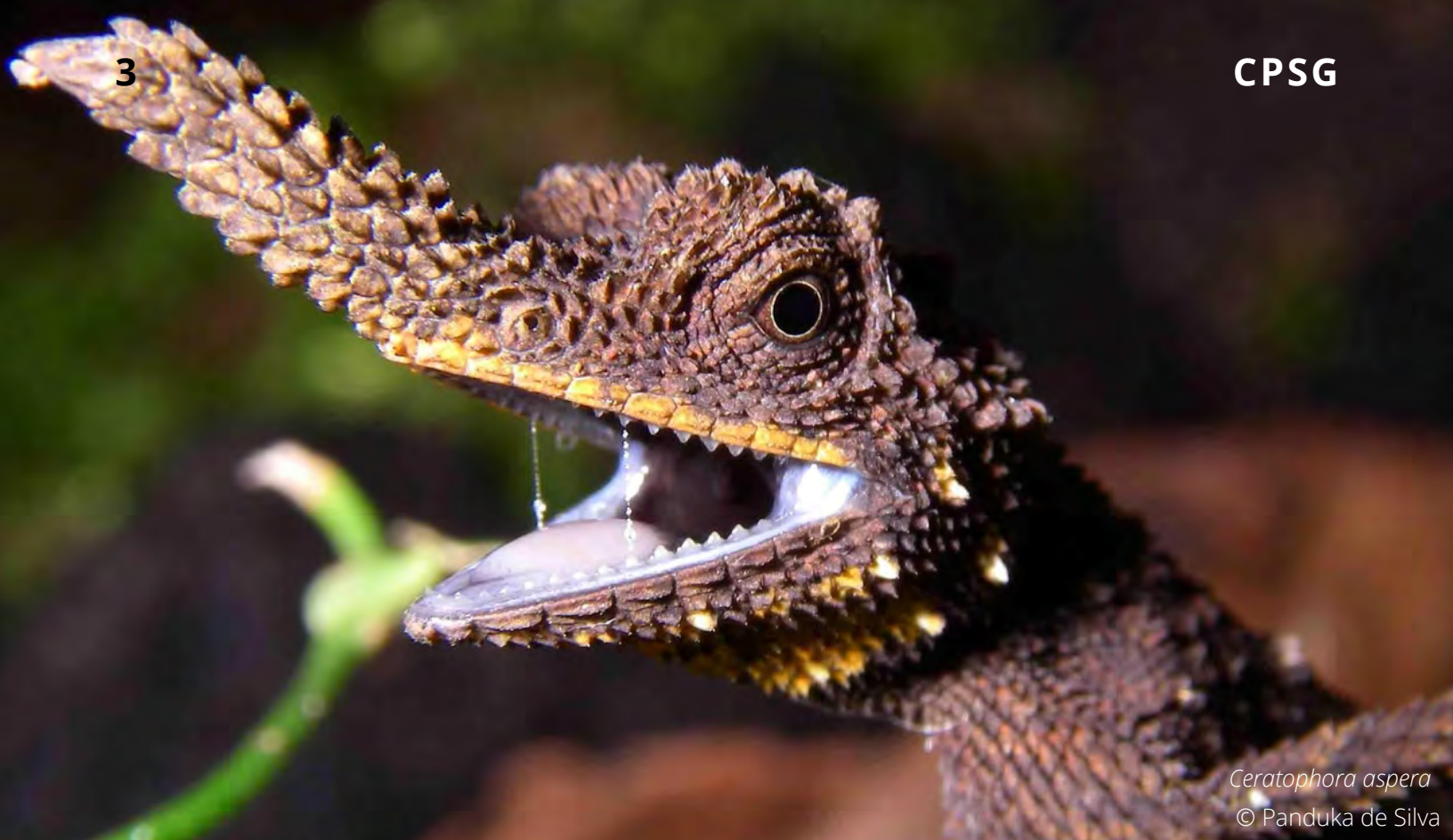
Ceratothrauda aspera