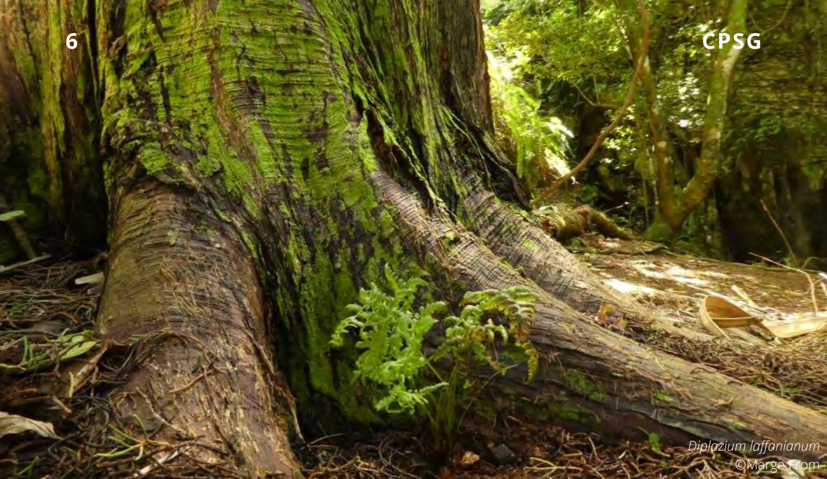
Diplazium laffanum