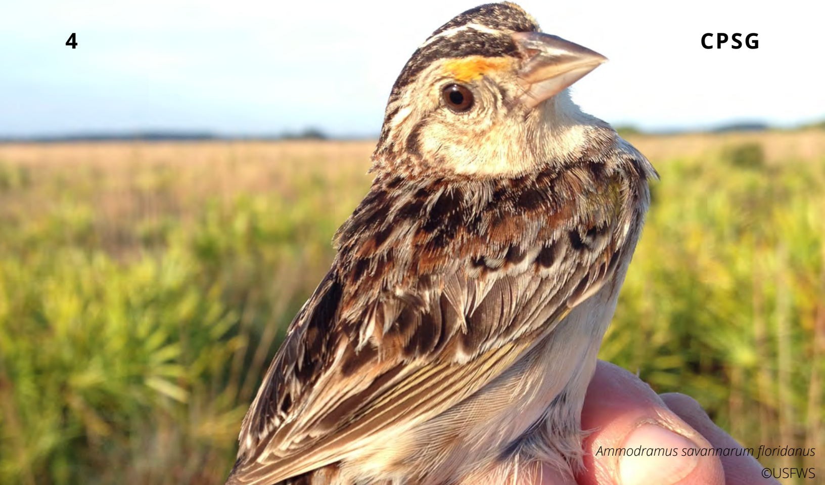
Ammodramus savannarum floridanus